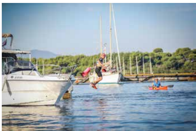
Passage des concurrents devant le monastère de l'île Saint Honorat

https://fr.wikipedia.org/wiki/%C3%8Ele_Saint-Honorat